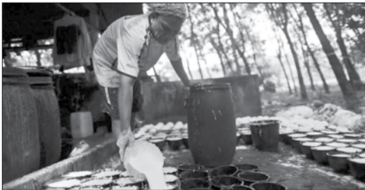
ထုတ်ပြန်ချက်အရ ပြည်ပသို့ တင်ပို့မည့် မြန်မာ့ရော်ဘာ FOB ဈေးနှုန်းများကို ဖော်ပြလိုက်ပါသည်။

မတ်လ ၃၀ ရက်မှ ဧပြီ ၁၉ ရက်အထိ ကာလအတွင်း ကော့သောင်းကုန်သွယ်ရေးစခန်းမှ ရော်ဘာ RSS-3 အမျိုးအစား သုံးတန်တင်ပို့ခဲ့ကြောင်း သိရသည်။ ယခုကာလအတွင်း မြန်မာ-တရုတ်နယ်စပ်မှ ရော်ဘာတင်ပို့မှုမရှိကြောင်းနှင့် ပင်လယ်ရေကြောင်းကုန်သွယ်မှုမှ မတ်လ ၃၁ ရက်မှ ဧပြီ ၂၀ ရက်အထိ ကာလအတွင်း အမေရိကန်ဒေါ်လာ ၅ သန်းကျော် တန်ဖိုးရှိရော်ဘာ အဆင့်စုံတန်ချိန် ၄၄၀၀ ကျော် တင်ပို့ခဲ့ကြောင်း သိရသည်။ တင်ပို့ခဲ့သောနိုင်ငံများမှာ မလေးရှားနိုင်ငံ၊ တရုတ်နိုင်ငံ၊ ကိုရီးယားနိုင်ငံ၊ ဂျပန်နိုင်ငံနှင့် အိန္ဒိယနိုင်ငံများဖြစ်ပြီး ဧပြီလအတွင်းမှာ ရော်ဘာတင်ပို့မှုလျော့ကျသော်လည်း သင်္ကြန်ပြီး ကာလမှာရော်ဘာ ဈေးတက်လာကြောင်း သိရသည်။