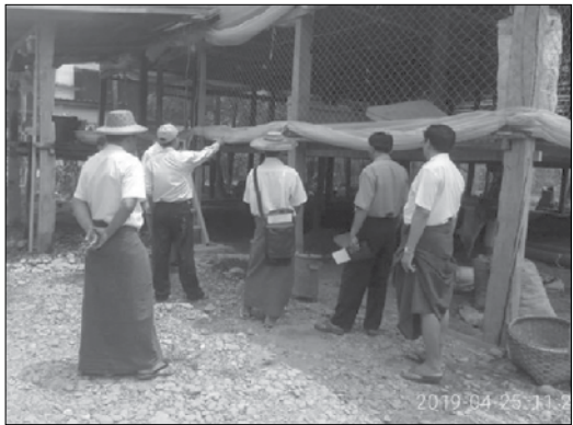
မွေးမြူရေးခြံများ ရွှေ့ပြောင်းစရိတ် မတတ်နိုင်ခြင်းများရှိကြောင်း သိရှိရသည်။

ကလေးမြို့၊ သာစည်ကျေးရွာ အုပ်စု၊ ချင်းဆိုင်ကျေးရွာ သည် အိမ်ခြေ ၂၁၆ အိမ်ရှိပြီးကြက်ခြံမွေးမြူသူဦးရေ ၅၀ ကျော်သည် ရွာထဲတွင်အနံ့ မွေးမြူနေသောကြောင့် ရွာတွင်း တွင် ကြက်ခြံမှ အနံ့ဆိုးများ၊ ယင်များပေါများနေပြီး ကျန်းမာ ရေးနှင့် နေထိုင်ရန်မသင့်သော အခြေအနေဖြစ်နေကြောင်း၊ ရွာတွင်းရှိ ရေနုတ်မြောင်းအတွင်းသို့ ကြက်ခြံများမှ ထွက်ရှိ သော အညစ်အကြေးများကို စွန့်ပစ်နေကြသည့်အတွက် ပတ်ဝန်းကျင်များညစ်ညမ်းနေပါသဖြင့် ကြက် မွေးမြူနေသော လုပ်ငန်းရှင်များလည်းအဆင်ပြေစေရန်နှင့် ရွာအတွင်းနေ ထိုင်သူများလည်း ကျန်းမာရေးမထိခိုက်စေရန် ရည်ရွယ်၍ ရွာအတွင်း မွေးမြူခြင်းမပြုဘဲရွာ အပြင်တစ်နေရာသို့ ကြက် မွေးမြူရေးဇုန်အဖြစ် မွေးမြူသင့်ကြောင်း တင်ပြတိုင်ကြားခဲ့ သည်။