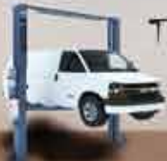
Two Post Lift

အမှတ် ၂၆/ဘီ၊ (၄)လမ်း၊ တောင်ဥက္ကလာပ (စက်မှုဇုန်)၊ ရန်ကုန်မြို့။ ရန်ကုန် ၀၁-၈၅၅၁၃၉၅ - ဗန္ဓုလေး ၀၉-၄၅၅၀၂၆၆၆၃