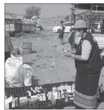
ဆည်းခွဲသော စုစုပေါင်းတန်ဖိုး ၁၅၆၉၅၄၂၈ ကျပ် တန်ဖိုးရှိသည့် တရား

မော်လမြိုင်ခရိုင် စားသုံးသူရေးရာ ဦးစီးဌာနမှ ခရိုင်ဦးစီးမှူးနှင့် ဝန်ထမ်း များသည် မွန်ပြည်နယ် အစားအသောက် နှင့် ဆေးဝါးကွပ်ကဲရေးဦးစီးဌာနနှင့် အခြားမိတ်ဖက်ဌာနများပါဝင်သော အဖွဲ့နှင့်ပူးပေါင်း၍ မွန်ပြည်နယ်အစား အသောက်နှင့် ဆေးဝါးကော်မတီ၏ ကြီးကြပ်မှုဖြင့် မွန်ပြည်နယ်အတွင်းရှိ မော်လမြိုင်မြို့နယ်၊ ချောင်းဆုံမြို့နယ်၊ ပေါင်မြို့နယ်တို့တွင် FDA နှင့် မိတ်ဖက် အဖွဲ့များမှဈေးကွက်အတွင်း မသိမ်း